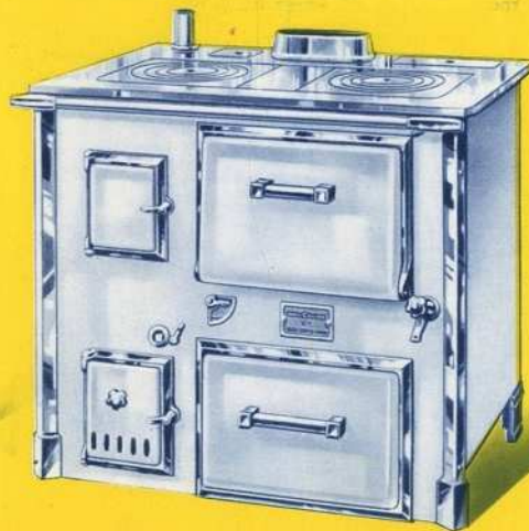
Fourneau "IDÉAL CULINA"

Très grande variété de modèles pour répondre à tous les besoins.