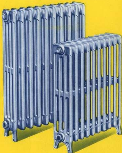
Radiateurs "IDÉAL NEO-CLASSIC"

Se fait en 6 hauteurs : de 0 m. 645 à 1 m. 150. Puissance : 6.000 à 28.800 calories.