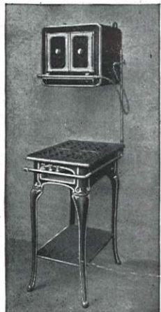
NOUVEAU CUISEUR A GAZ pour griller, cuire pâtisserie. TABLE A GAZ à deux brûleurs.

Todas las clases de hornos. Nuevo método para toda clase de cocinas á gas, carbón, leña.